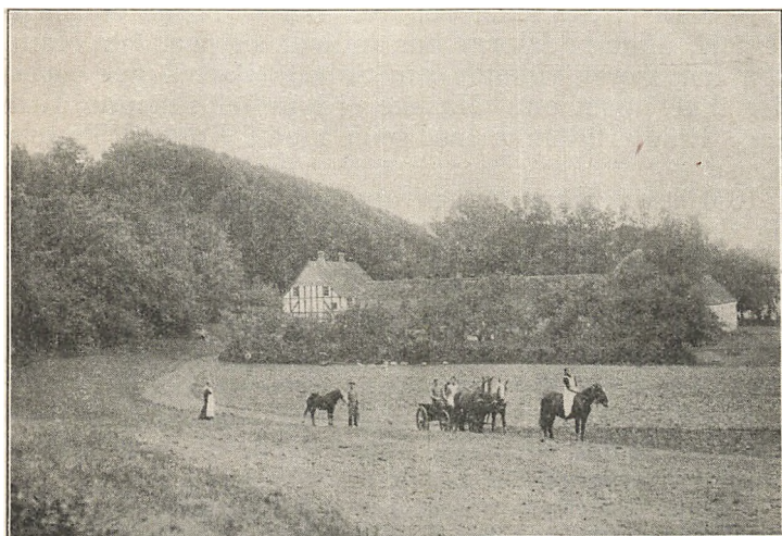
Linaa Storgaard (set fra Øst).